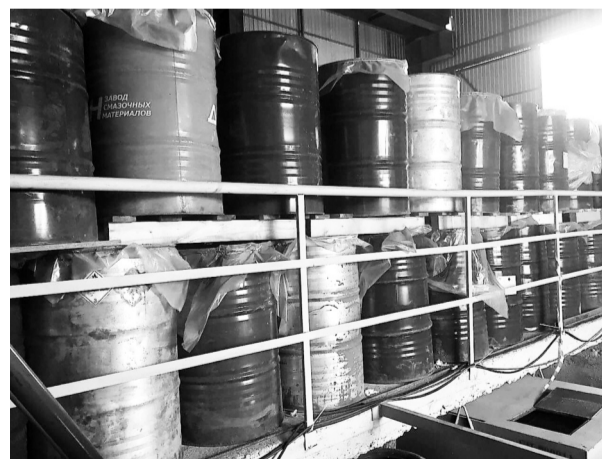
На складе ГСМ нарушений быть не должно

Ленское управление Ростехнадзора в феврале 2022 года провело внеплановый выездной контроль в отношении опасных производственных объектов, эксплуатируемых ГУП «ЖКХ РС (Я)». Были проверены два склада ГСМ и площадка нефтебазы. Зафиксировано 38 нарушений обязательных требований промышленной безопасности. В их числе эксплуатация технических устройств и сооружений с истекшим сроком службы без положительного заключения экспертизы промышленной безопасности; обеспечение готовности к действиям по локализации и ликвидации их последствий; от-