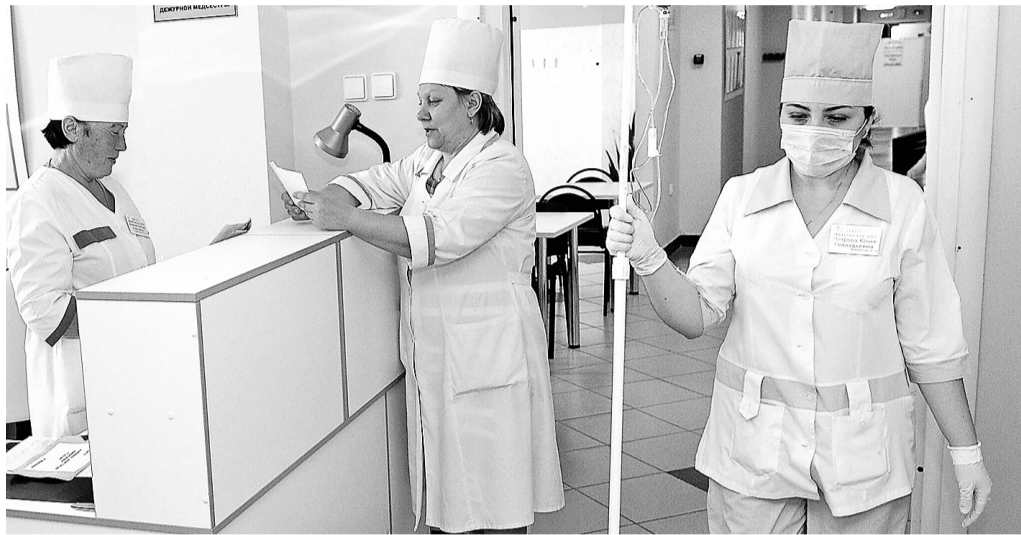
Врачам тоже нужна помощь

ГОСИНСПЕКТОРЫ ПОМОГАЮТ ВОССТАНОВИТЬ СПРАВЕДЛИВОСТЬ