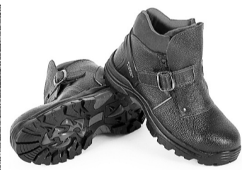
Обувь защищала ноги во все времена

ванные заводы и фабрики по производству рабочей обуви. Резиновые сапоги распространились повсеместно, а кожаная обувь ушла на второй план из-за высокой стоимости.