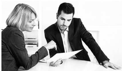
В ходе визита инспектора работодатели получают необходимые разъяснения