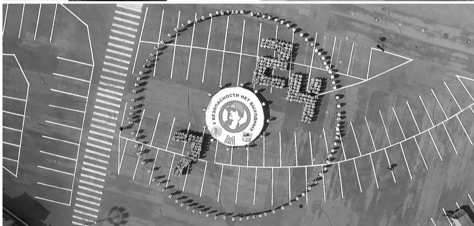
Квесты и флешмобы по охране труда надолго останутся в памяти

тическим семинаром, где сотрудникам станции презентовали инновационные средства индивидуальной защиты. Атомщики познакомилась с новинками – технологиями, оборудованием и спецодеждой. Но этим предприятие не ограничивается: ежегодно здесь проводят конкурс на знание правил ОТ среди представителей инженерных и рабочих специальностей, а также детские творческие конкурсы в соцсети и открытые уроки для школьников.