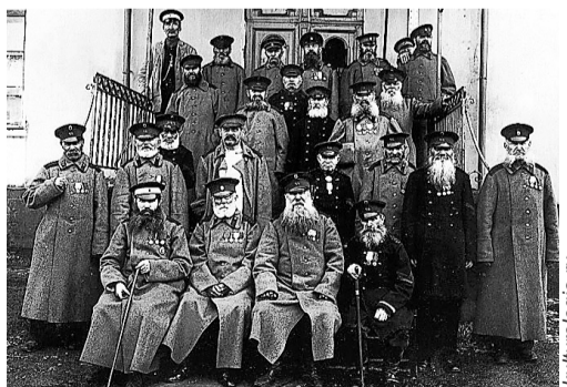
Первые пенсионеры – военные