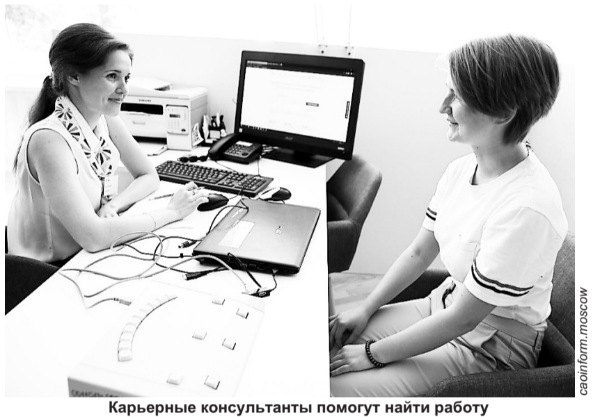
Карьерные консультанты помогут найти работу