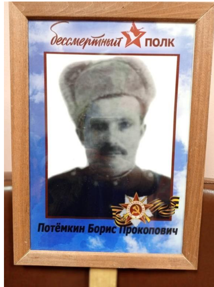
Потёмкин Борис Прокопович